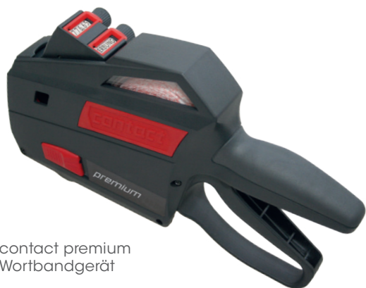
contact premium Wortbandgerät

Mit unseren contact premium Wortbandgeräten lassen sich mit nur einem Dreh komplette Worte einstellen. Für im Gastro-Bereich häufig verwendete Begriffe, wie „mindestens haltbar bis“ oder „hergestellt am“, bieten wir Ihnen Wortbandgeräte mit diesen und ähnlichen vorgegebenen Begriffen an.