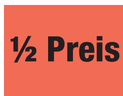
Etikett verkleinert dargestellt