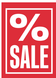
Motiv B (% SALE)