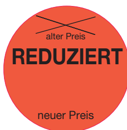
Etikett verkleinert dargestellt