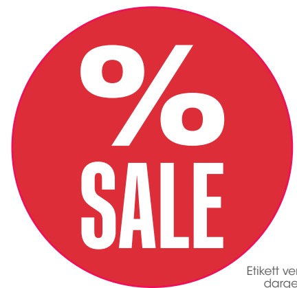
Etikett verkleinert dargestellt

Auch der Allwetteraufsteller von contact lädt zum Einkaufen ein. Er setzt Rabattaktionen in Szene und trotz Wind und Wetter. Der Allwetteraufsteller ist als Standard-Variante ohne Plakate oder als Set mit zwei passenden Plakaten bestellbar.