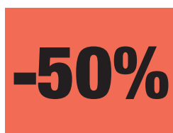
Etikett verkleinert dargestellt