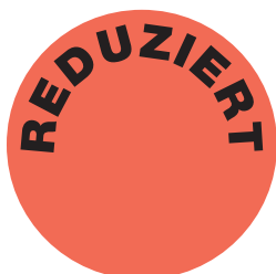
Etikett verkleinert dargestellt