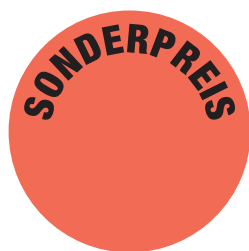
Etikett verkleinert dargestellt