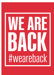
Motiv A (WE ARE BACK)