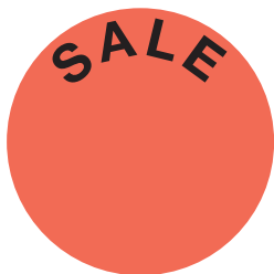
Etikett verkleinert dargestellt