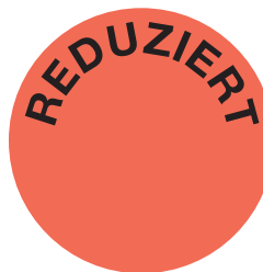
Etikett verkleinert dargestellt