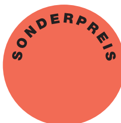
Etikett verkleinert dargestellt