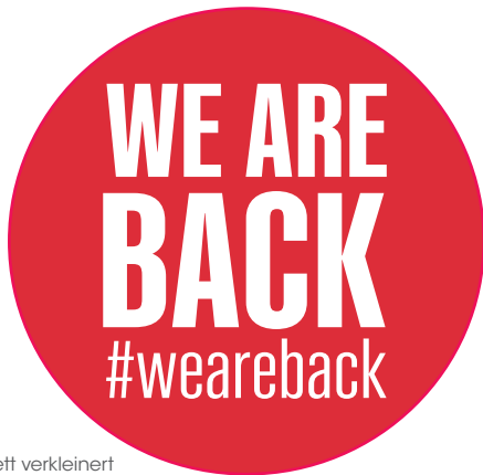
Etikett verkleinert dargestellt

Endlich können Sie Ihre Kunden wieder persönlich im Laden begrüßen. Mit auffälligen Schaufenster-Etiketten und Außenaufstellern machen Sie werbewirksam auf sich aufmerksam und begeistern Ihre Kunden für einen Besuch.