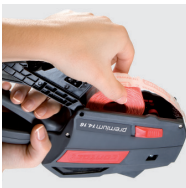
schnell und einfach