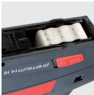
sicher und exakt