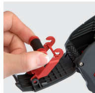
sauber und leicht

Etikettengröße 25x12 / 26x12 / 25x16 / 26x16