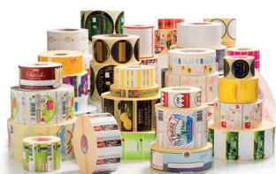
Etikettenaufwickler und Etiketten